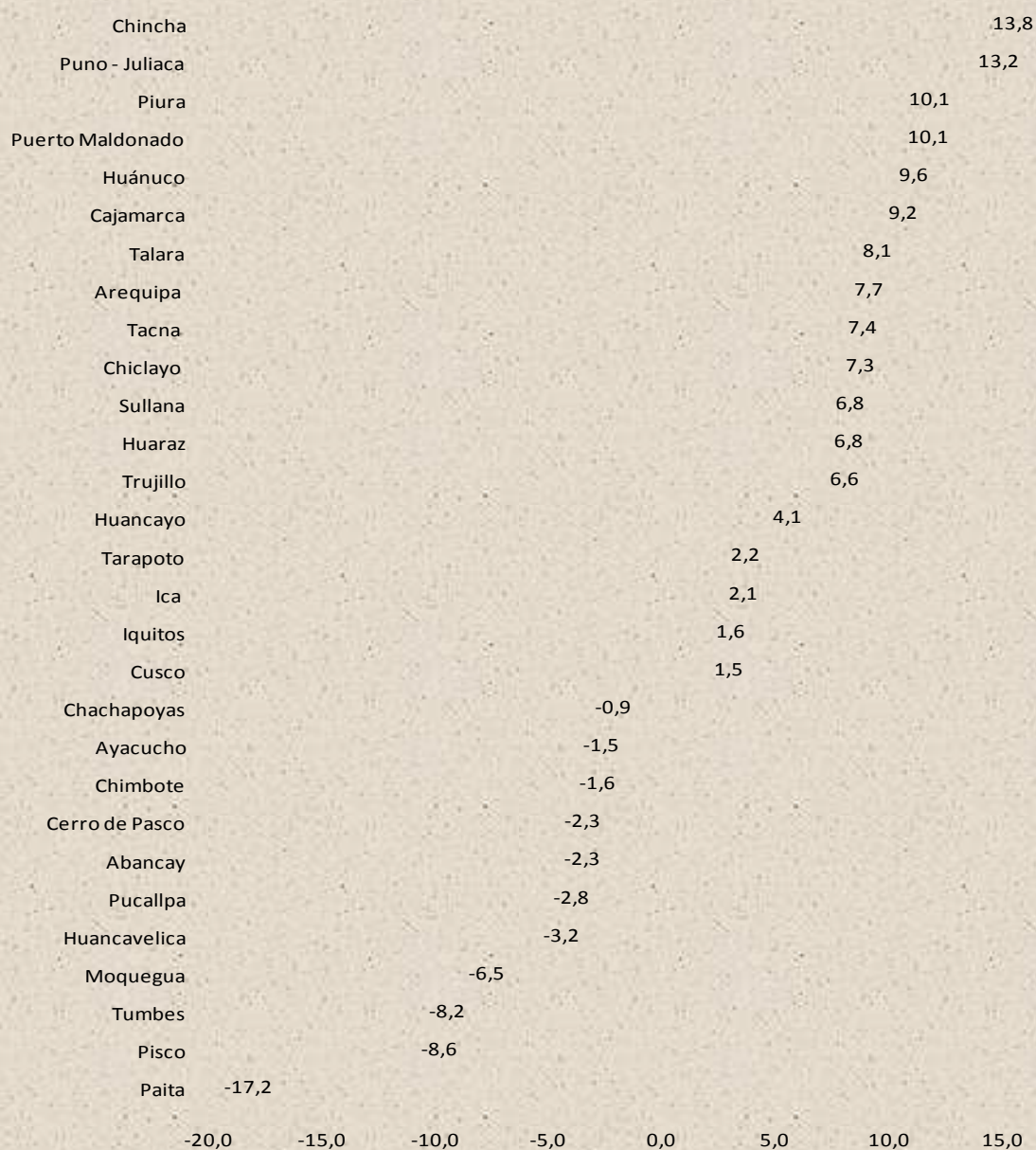
Gráfico N° 3 Principales ciudades: Variación anual del empleo en empresas privadas de 10 y más trabajadores, noviembre 2010 / noviembre 2009 (En porcentaje)

Nota: la información corresponde al primer día de cada mes.