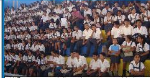
Niños representativos de sus comunidades participarán del I Encuentro Regional Infantil en Moyobamba

El Gobierno Regional de San Martín a través de la Gerencia Regional de Desarrollo Social viene organizando la realización del I Encuentro Regional Infantil "Derecho a la salud, educación, participación y protección social" que congregará a niños de las 10 provincias de la región en Moyobamba del 18 al 20 de noviembre, en el marco de los 20 años de la Convención sobre los derechos del Niño. Se busca crear un espacio de participación para que niños, niñas y adolescentes reconozcan, reflexionen, formulen propuestas y compromisos personales y grupales sobre el ejercicio de sus derechos y su participación. El evento, será inaugurado por el Presidente Regional Lic. César Villanueva Arévalo. Para ello está coordinando permanentemente con los socios estratégicos Prisma, MSH, Calandria, Cedis, Calf Mesa de Concertación para la Lucha Contra la Pobreza, Sector Educación y Asociación de Municipalidades de la Región San Martín -AMFREGSAM.